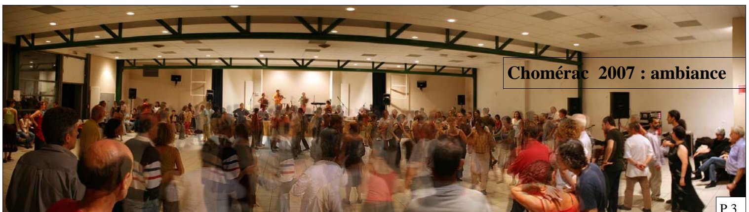
Chomérac 2007 : ambiance