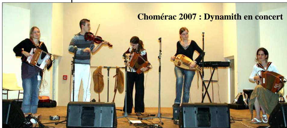
Chomérac 2007 : Dynamith en concert