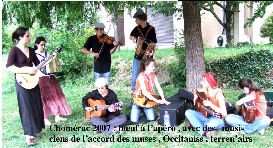
Chomérac 2007 : bœuf à l'apéro , avec des musiciens de l'accord des muses , Occitaniss , terren'airs